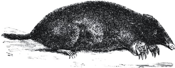
Fig. 58. — Taupe commune.

- Et comment il s'appèlerait notre fanzine?